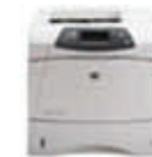
Impresora de Sobres de Tarjetas

1 – El Sistema Central procesa los archivos de tarjetas para generar las cardenas de datos con el formato apropiado para la impresorara de tarjetas y la impresora de sobres de tarjetas, reemplazando los espacios de CVV y PIN por tokens.